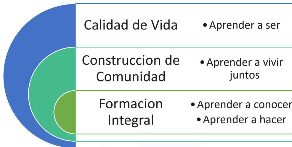
Ilustración 1. Modelo de Bienestar

Con lo anterior, la vida universitaria y el desarrollo humano integral en FESSANJOSÉ se apoyan en el mejoramiento de la calidad de vida, la formación integral de los individuos, el bienestar y la sana convivencia de todos los miembros de la comunidad académica. Para ello, Bienestar Institucional, como ente responsable de estos procesos, direcciona toda su gestión hacia la atención de los individuos en todas sus dimensiones y realizará acompañamiento permanente a las dinámicas institucionales bajo principios y estándares de calidad en sus servicios.